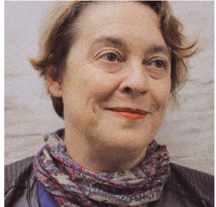
Fotografía de Teatro Al Punto

Imparte cursos de interpretación y dramaturgia en escuelas o instituciones como AISGE, Estudio Juan Codina, Universidad Complutense de Madrid o en el Centro Dramático Nacional.