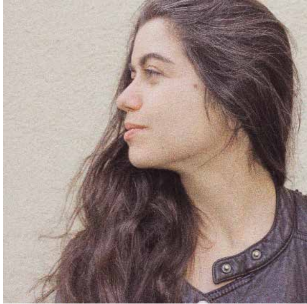
fotografía de Teatro Al Punto