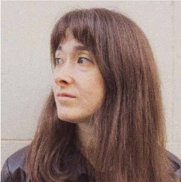
fotografía de Teatro Al Punto