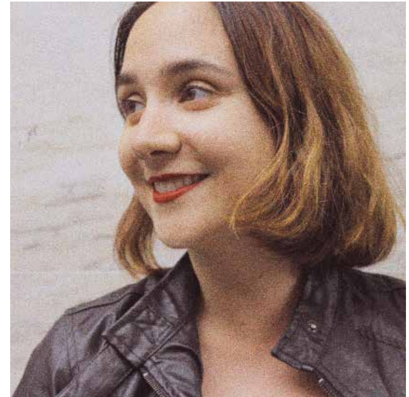
Fotografía de Teatro Al Punto

Es profesora universitaria, impartiendo materias relacionadas con el arte y la escena contemporáneas; además de numerosos laboratorios experimentales relacionados con el arte escénico dentro y fuera de España. Es autora de varias publicaciones relacionadas con la cultura y el arte contemporáneos.