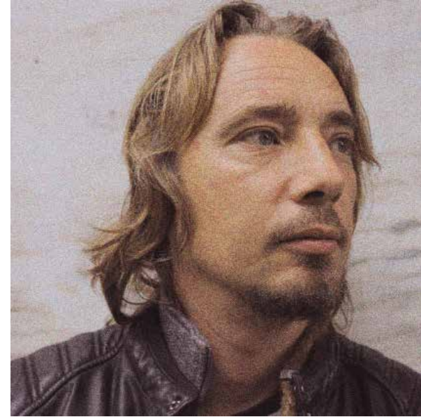
fotografía de Teatro Al Punto

Participa activamente en las giras de los espectáculos realizando, entre otras funciones, la de regiduría. Continúa actualizando su formación artística y teatral e investigando sobre las expresiones plásticas.